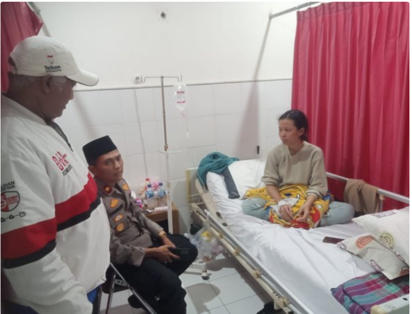
Kapolsek Jatibarang Menjenguk Anggota KPPS Yang Sedang Sakit